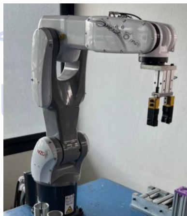
รูปที่ 2 ตำแหน่ง Home ของแขนกล

เงื่อนไขที่ 10 หลังจากทำงานเสร็จหมดแล้ว ให้แขนกลกลับตำแหน่ง Home และ LED สีเขียว ดับ ให้ LED สีแดง กระพริบ 0.5 วินาที